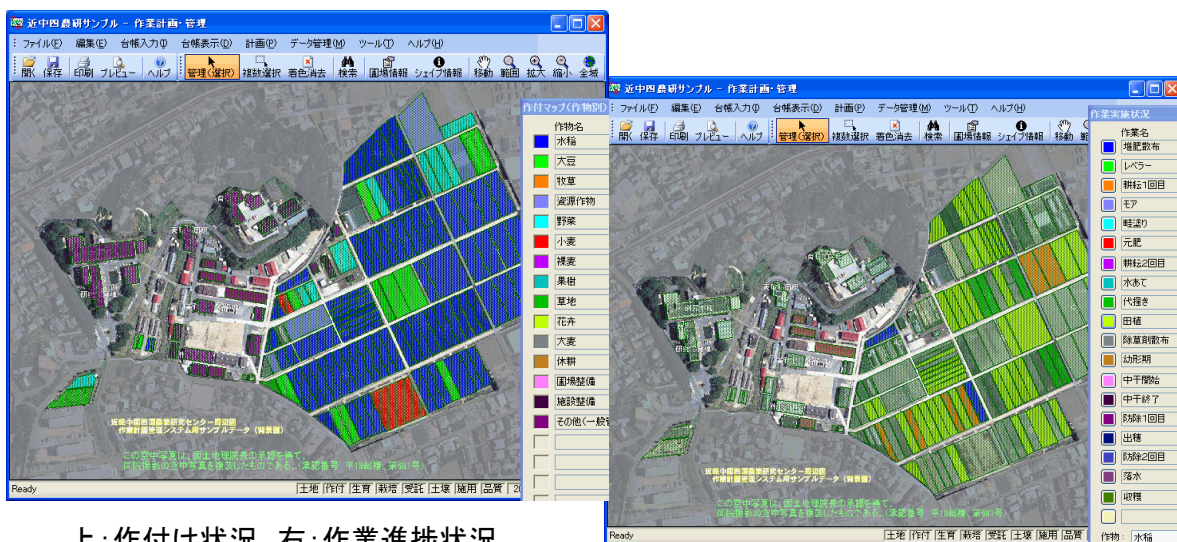
上：作付け状況，右：作業進捗状況